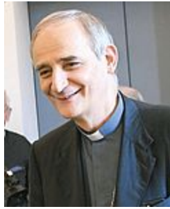
L'arcivescovo di Bologna Matteo Zuppi

Bufera in Comune Comunicazione e partecipate, scoppia il caso trasparenza «Merola indecente»